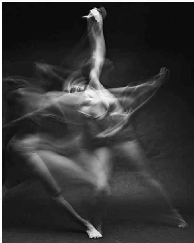
Fotografía de la serie Motion de Bill Wadman. Recuperada de https://tinyurl.com/yc9x6um8

¿Cuál es el recurso visual que más destaca en la siguiente fotografía de Bill Wadman (Estados Unidos, 1975)?